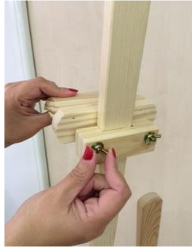
Vue arrière du sabot

Vissez les deux éléments du sabot ensemble en insérant la flèche entre les deux (en partie haute).