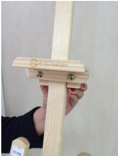
Vue avant du sabot