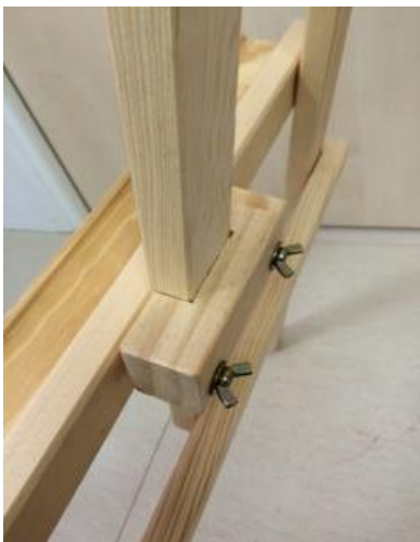
Vue arrière de la tablette

Vissez les deux éléments de la tablette ensemble en insérant la flèche entre les deux (en partie basse).