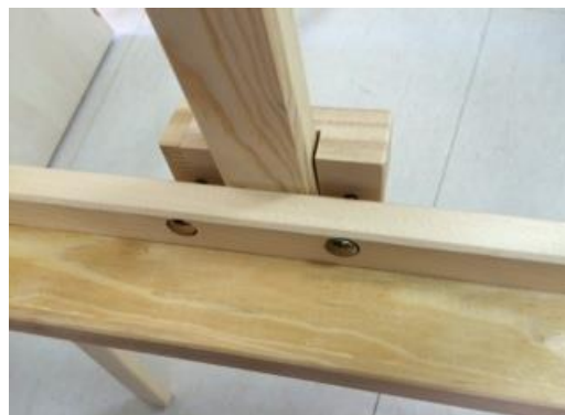
Vue avant de la tablette